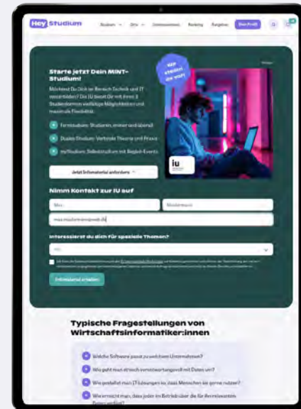
Content Ad mit Lead Formular