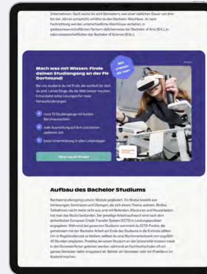
Langversion mit Subline

Alles, was Sie liefern müssen, sind Bild, Text und Call to Action, um den Rest kümmern wir uns.